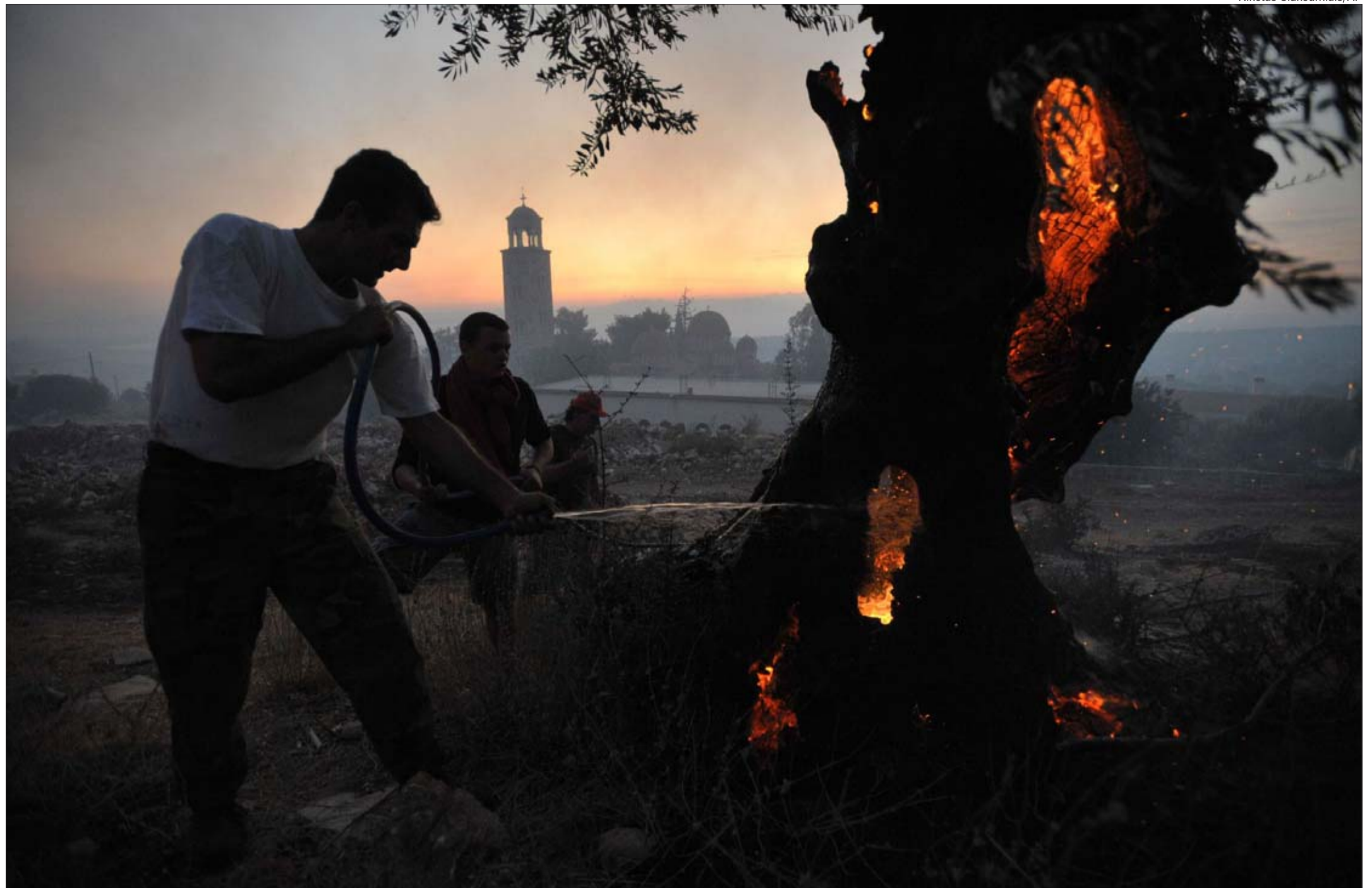
Vapaaehtoiset suihkuttivat letkulla vettä palavaan puuhun lähellä Nea Makria maanantaina. Taustalla näkyvä luostari jouduttiin evakuoimaan maastopalojen vuoksi.