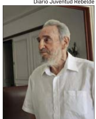
Fidel Castro nähtiin pitkästä aikaa valokuvissa viime perjantaina.

Kuka: Kuuban entinen presidentti Fidel Castro tuli pitkistä aikaa maansa televisioon opiskelijaryhmän kanssa. Castro luopui presidentin virasta helmikuussa 2008.